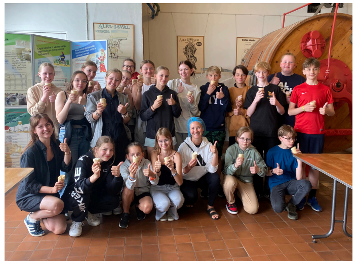
Pille Peebu Gümnaasiumi saksa keele õpetaja

A. Comeniuse kooli õpilased külastavad meid sügisel 2025, mil saame juba loodud kontakte värskendada ning omaltpoolt meie kooli, Eestit ning eesti ajalugu tutvustada. Reisid koos projektidega on veel planeerimisjärgus ning oleme avatud ideedele, mis loovad sideme ning aitaksid neid reise kõigile osalistele meeldejäädavaks teha.