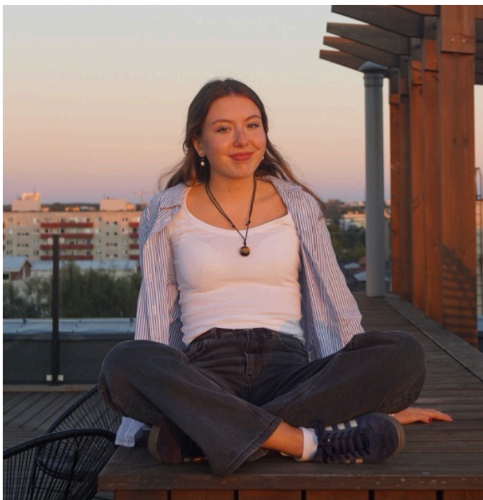
Katrin Aksiim Põhikooli saksa keele õpetaja

Rõõmustan juba ette meie ühise aja üle ning loodan, et saan siin abiks ja toeks olla.”