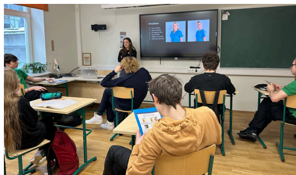
Sära jagamas kogemusest Maxilla hambakliinikus

Detsembris käisid 9. klassi õpilased Töötukassa karjäärikeskuses, kus õpilastele räägiti karjäärivaliku võimalustest ning tutvustati vahendeid, kus ja kuidas õpilased saavad teha isiksuse- ja kutsesobivusteste. Kolmandal perioodil toimuvad aga õpilastele töövarjupäevad, kus ka tänu lapsevanemate kaasatusele on õpilastel võimalik vaadelda väga erinevaid töökohti ja ameteid nii erasektoris kui avalikus sektoris.