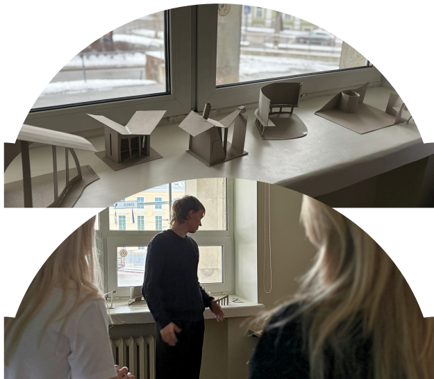
Arhitektuuri kursusel loodud makettide esitlemine

valikkursused ülikoolide õpilaskadeemiate pakutava seast. Kus ülikoolide õppejõud juba noori ülikooli eluette valmistavad.