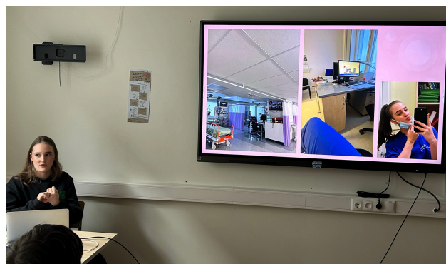
Elina jagamas kogemusest Ida-Tallinna keskhaigla neuroloogia osakonnas